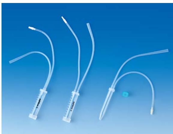
カタログ番号：2586S 2586-MS 2583-10S